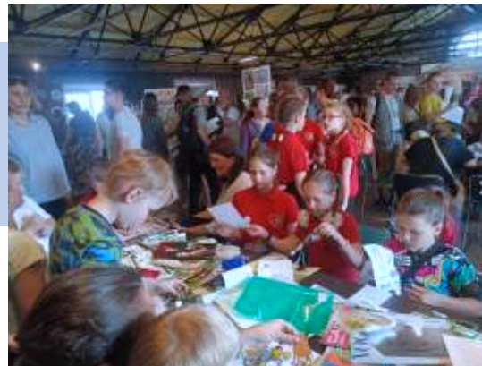
Приняли участие в финальном мероприятии проекта «АРТ-краеведение»