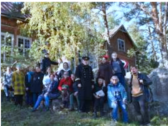
Предоставили площадку для проведения встречи краеведов Карельского перешейка