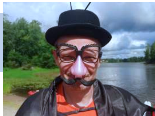
Соорганизаторы карнавального фестиваля «Цокотуха фест»