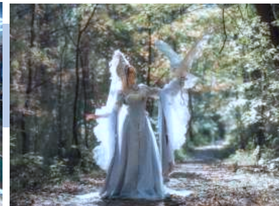
Организовали опен-колл художникам для участия в выставке