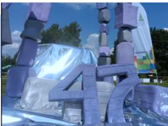
Приняли участие в Гражданском форуме Ленинградской области