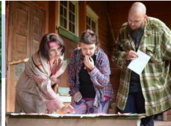
Приняли участие в автоквесте «Тайны прихода Ряйсяла»