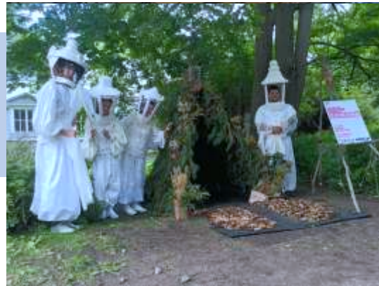
2-х дневный перформанс по созданию арт-объект на фестивале «Пикник Афиши»